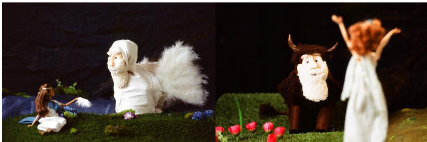
Quand Zeus se transforme...

besoin technique : une prise de courant, possibilité de créer de l'obscurité