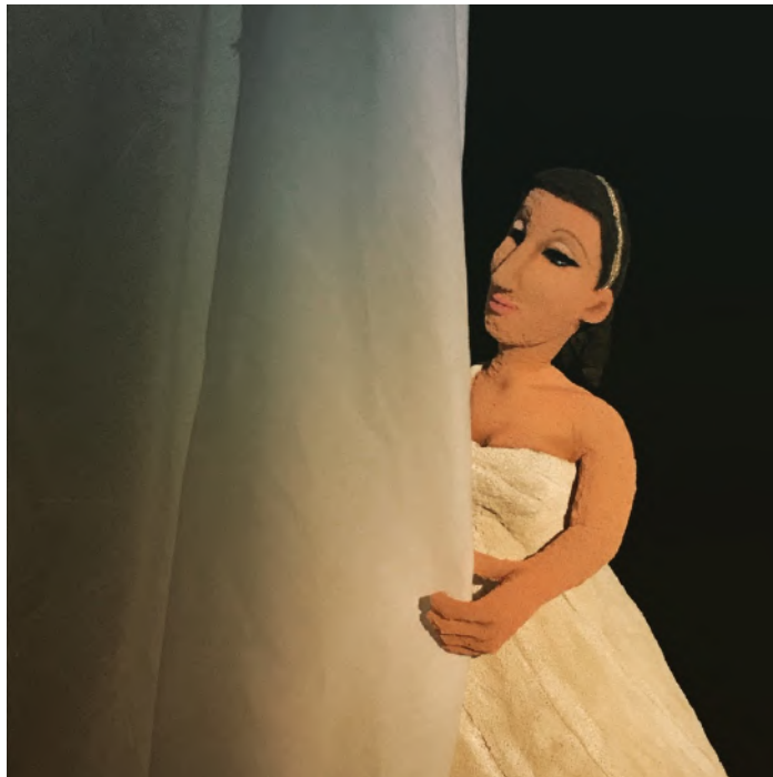
La princesse Io se cache de Zeus ...qui n'est pas loin !