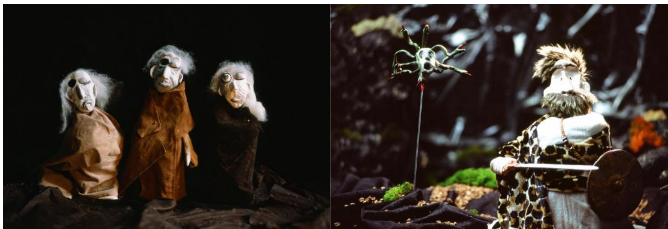
Les grées, sœurs de Méduse, que Persée va terrasser au fond de sa caverne...