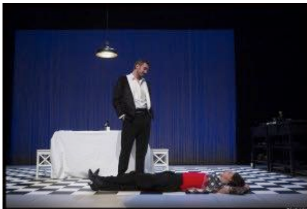
La tension sexuelle est palpable entre Mademoiselle Julie et Jean

Faute d'une mise en scène puissante, resserrée, d'une scénographie à l'esthétisme tranché, d'un jeu de lumière léché, la passion, la violence reste encore trop retenue et l'espace trop grand, trop vide. Un peu groggy, un peu assommé, on sort de cette Mademoiselle Julie avec la faim au ventre n'ayant en bouche que quelques saveurs suaves dont l'insolite présence d' Anna Mouglalis et le charme discret de Xavier Legrand .